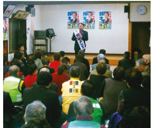
▶ 個人演説会で政策を訴える (H24年12月8日)