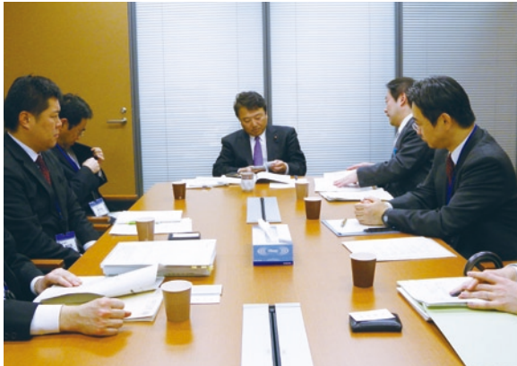
▶ 役所幹部を部屋に呼んで政策のレクチャーを受ける (H25年2月7日)