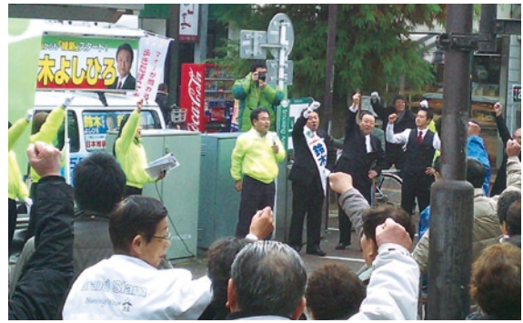
▲ 皆様の大きな声援を力に変えて… (H24年12月4日)