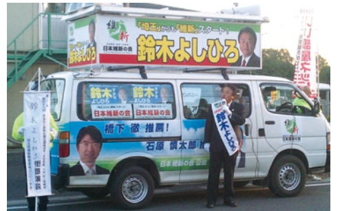
▲ 街頭で改革への思いを熱く訴える (H24年12月7日)