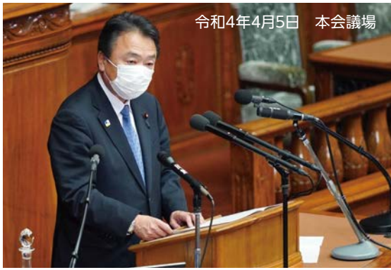
令和4年4月5日 本会議場